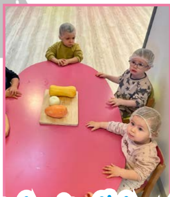
les bouts d'choux de la crèche

Je vous souhaite à toutes et tous, et en particulier aux enfants, un Noël joyeux, doux et féerique. "