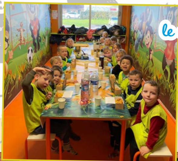
le centre de loisirs 4-13 ans