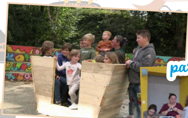
les ateliers parentalité