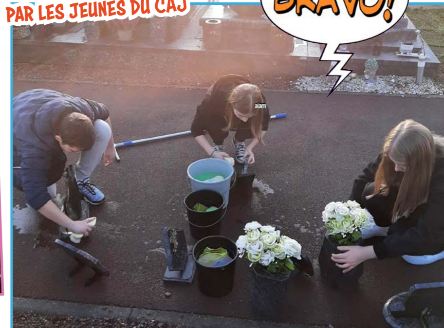
ACTION CITOYENNE PAR LES JEUNES DU CAJ

Les jeunes du CAJ ont renouvelé leur action citoyenne de nettoyage des tombes avant la période de la Toussaint. Une action appréciée par les personnes, en particulier nos aînés, qui ne peuvent plus se charger de cet entretien.